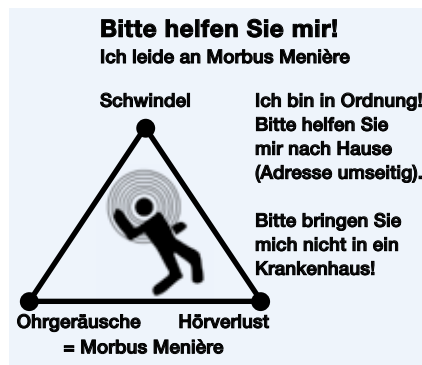
Abb.: Die »Hilfe-Karte«

Antiemetika als Suppositorien sind meist genauso schnell wirksam wie ein Notarzt eintreffen kann. Bei nicht-suchtgefährdeten Patienten kann man etwa Tavor® expidet als sublingual schnell resorbierbares und hochwirksames Diazepam für den Bedarfsfall